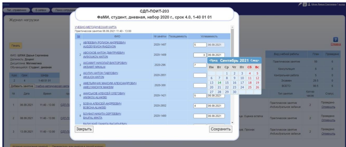
Рисунок 4 – Режим редактирования

4) При нажатии на «Журнал посещаемости» открывается pdf-версия журнала учета успеваемости и посещаемости.